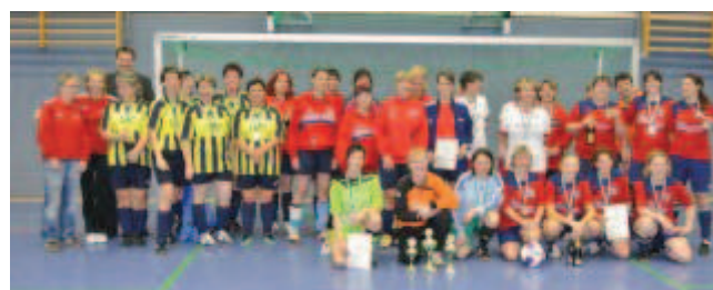
Alle Teams im März 2013