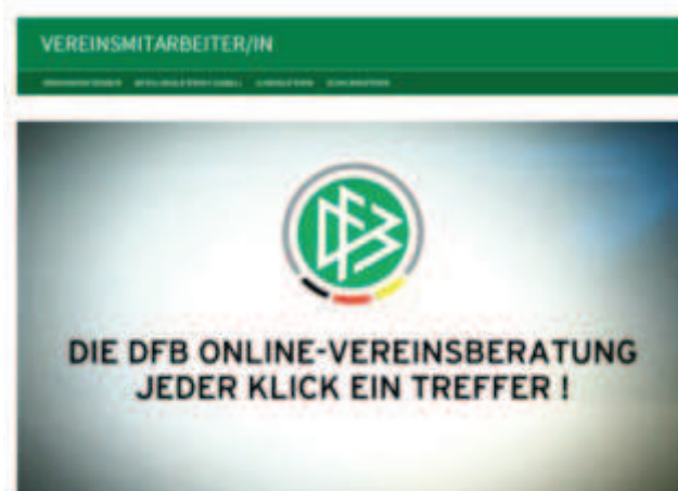
Trailer zur Onlinevereinsberatung (Klick aufs Bild)

Online-Vereinsberatung: http://meinfussball.dfb.de/