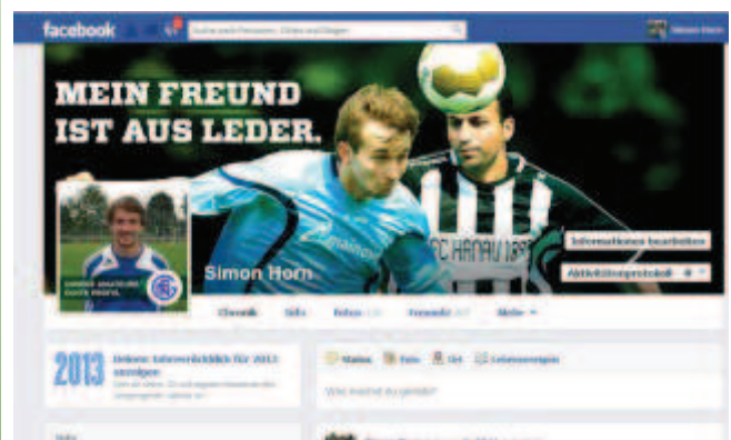
Beispiel für die Facebook-App (dfb.de)

Weil Fußball ein Mannschaftssport ist, sollst du natürlich auch an deine Freunde denken. Gestalte individuell Titelbilder für sie und schicke sie ihnen als persönliche Nachricht. Deine Freunde können dann die Bilder weiter bearbeiten oder gleich auf ihrem Profil verwenden.