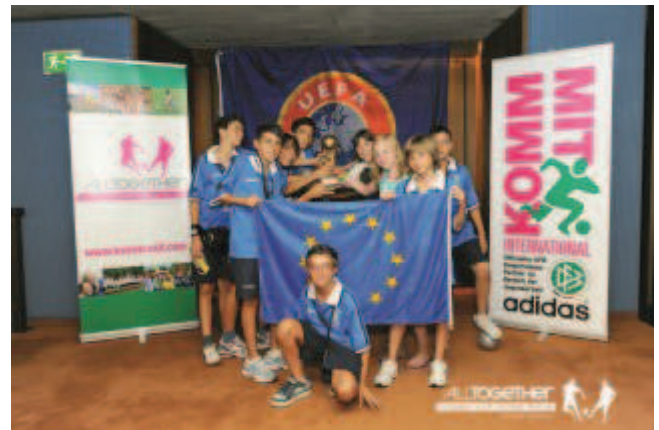
KOMM MIT Turnier in Berlin

Fußballspaß pur auf internationaler Bühne erleben – dazu lädt KOMM MIT alle Jugendmannschaften der Altersklassen U11 bis U17 Junioren, sowie U13 bis U17 Juniorinnen ein. Weitere Informationen zum Turnier finden Sie unter www.all2gether.eu.com .