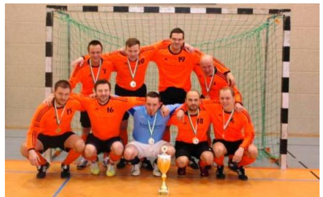
Hallen-Landesmeister Freizeitfußball der Herren 2013, SC Borea Dresden

Am 02.02.2013 gegen 10:00 Uhr war es wieder soweit, im Bereich Freizeit- und Breitenfußball, wurde die Hallensaison mit der Landesmeisterschaft der Freizeitfußballer eröffnet. Berichte, Ergebnisse und Bilder unter folgendem: Link