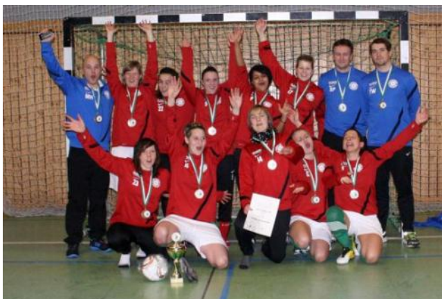
Sieger SFV-Futsal-Cup der Frauen 2013, SV Eintracht Leipzig-Stüd