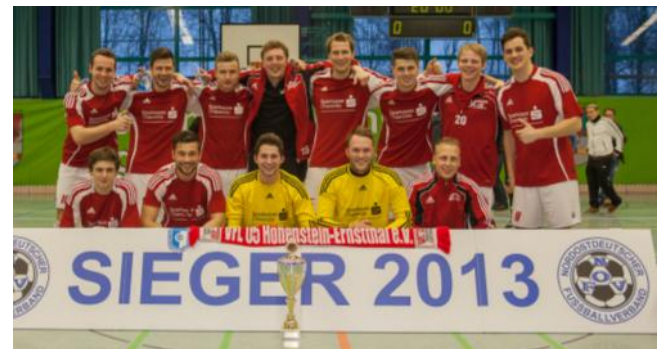
Sieger NOFV-Futsalmeisterschaft der Herren 2013, VfL 05 Hohenstein-Ernstthal

VfL hatten sich für diese überregionale Meisterschaft qualifiziert. Scheiterte der VfL im vergangenen Jahr noch im Finale an Croatia Berlin, so konnten die Hohensteiner 2013 erstmals die NOFV-Futsalmeisterschaft der Herren nach Sachsen holen. Durch diesen Triumph qualifizierte sich der VfL für das Viertelfinale um den DFB-Futsal-Cup am 16./17. März, Gegner ist auswärts der UFC Münster (Sieger Regionalverband West). Alle Spiele, Ergebnisse und Bilder in der Übersicht unter folgendem: Link