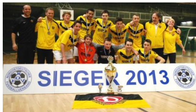
Oberes Foto: Sieger im NOFV-Futsal-Cup der Herren: Vfl 05 Hohenstein-Ernstthal