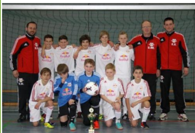
Sieger U13 Talente-Cup 2013, RasenBallSport Leipzig

Das Programm der sächsischen Hallenwettbewerbe wurde schließlich mit dem Talente-Cup für die U13-Mannschaften der Leistungszentren vervollständigt. Bei diesem in Priestewitz ausgespielten Turnier kam RasenBallSport Leipzig vor dem Chemnitzer FC und Dynamo Dresden zum Turniersieg. Alle Spiele, Ergebnisse und Bilder in der Übersicht unter folgendem: Link