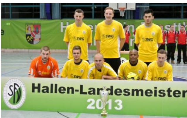
Hallen-Landesmeister Herren 2013, NFV Gelb-Weiß Görlitz

Alle Spiele, Ergebnisse und Bilder in der Übersicht unter folgendem: Link