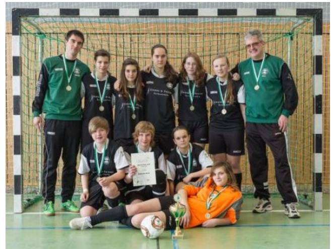
Sieger SFV-Futsal-Cup C-Juniorinnen 2013, Radebeuler BC