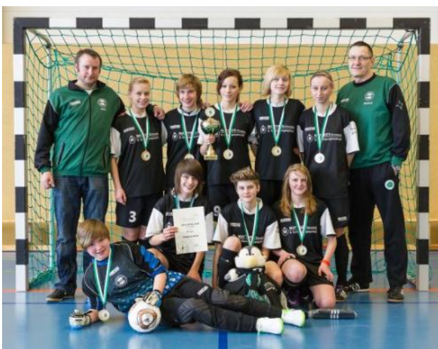
Sieger SFV-Futsal-Cup B-Juniorinnen 2013, Radebeuler BC