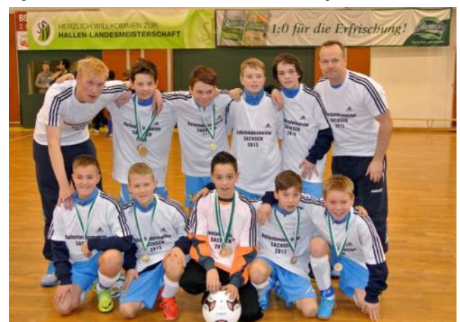
Hallen-Landesmeister D-Junioren 2013, Chemnitzer FC

Beim Endrundenturnier der D-Junioren in Zwickau, das ohne die U13-Mannschaften der Leistungszentren ausgespielt wurde, qualifizierten sich in den Gruppenspielen der Chemnitzer FC (U12), 1.FC Lokomotive Leipzig, Hoyerswerdaer SV und SG Dresden-Striesen fürs Halbfinale. Dort bezwang Chemnitz Hoyerswerda mit 2:0, während sich Lok Leipzig gegen Dresden-Striesen mit 3:0 durchsetzte. Das Finale endete nach regulärer Spielzeit mit 1:1, so dass es eines Neunmeterschießens zur Entscheidung bedurfte, bei dem sich die Chemnitzer Jungs mit 3:2 schließlich den begehrten Hallentitel sicherten. Alle Spiele, Ergebnisse und Bilder in der Übersicht unter folgendem: Link