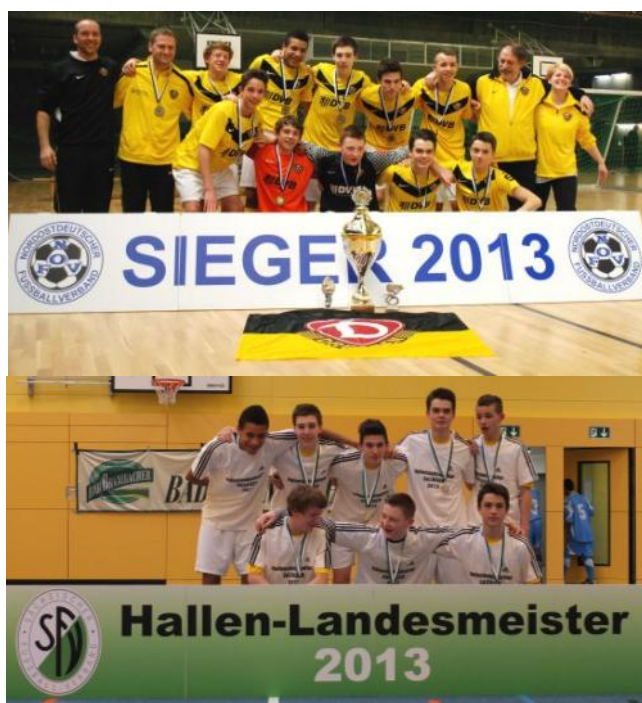
Sieger NOFV-Hallenmeisterschaft 2013 und Hallen-Landesmeister der C-Junioren 2013, SG Dynamo Dresden

Bei den C-Junioren in Hartha hatten die Dresdner in den Gruppenspielen gegen Zwickau (5:0), Lok Leipzig (3:0) und Hohenstein-Ernstthal (1:0) zunächst nur wenig Mühe, ins Halbfinale vorzustoßen. Umso spannender verlief dann das Halbfinalspiel gegen Erzgebirge Aue: in der ausgeglichenen und eng umkämpften Partie stand es nach Ablauf der Spielzeit 1:1, so dass erst ein Neunmeterschießen zur Entscheidung führte. Dort behielt Dynamo mit 5:3 die Oberhand und zog ins Finale ein. Im zweiten Halbfinale setzte sich der VfL Hohenstein-Ernstthal knapp mit 3:2 gegen den Chemnitzer FC durch. Somit kam es im Finale zum nochmaligen Aufeinandertreffen von Dynamo Dresden und Hohenstein-Ernstthal, bei dem die Dynamos erneut die Oberhand (3:1) behielten. Den dritten Meisterschaftsplatz sicherte sich der Chemnitzer FC mit einem ungefährdeten 5:0 über FC Erzgebirge Aue. Alle Spiele, Ergebnisse und Bilder in der Übersicht unter folgendem: Link